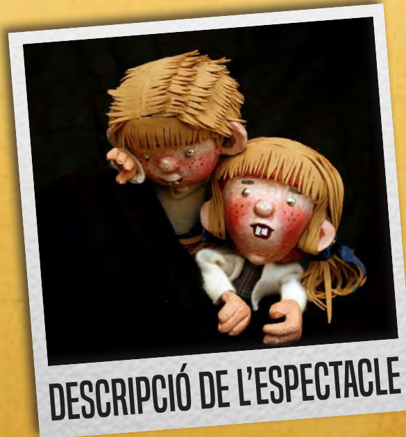
DESCRIPCIÓ DE L'ESPECTACLE